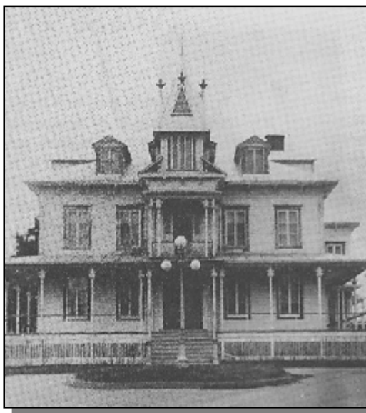
Extrait du livre : Historique de St-Honoré-de-Shenley, pages 31 et 32